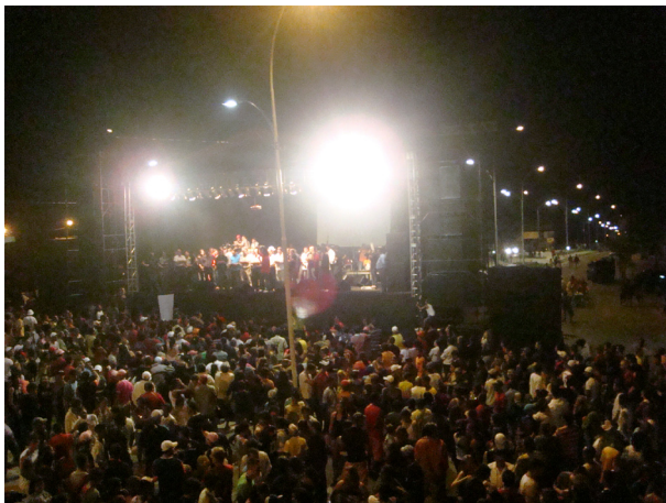
Imagem 04: Inauguração da pista de caminhada da Av. Juscelino Kubitschek em 08 de maio de 2009.